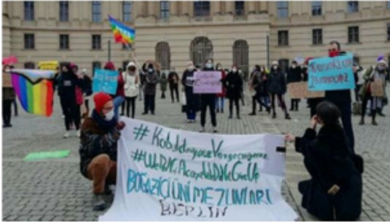
Almanya'da LGBT bayraklı Boğaziçi protestosu.

Haber Merkezi · 10 Ocak 2021, 12:07 · Son Güncelleme: 10 Ocak 2021, 12:17 · Diğer